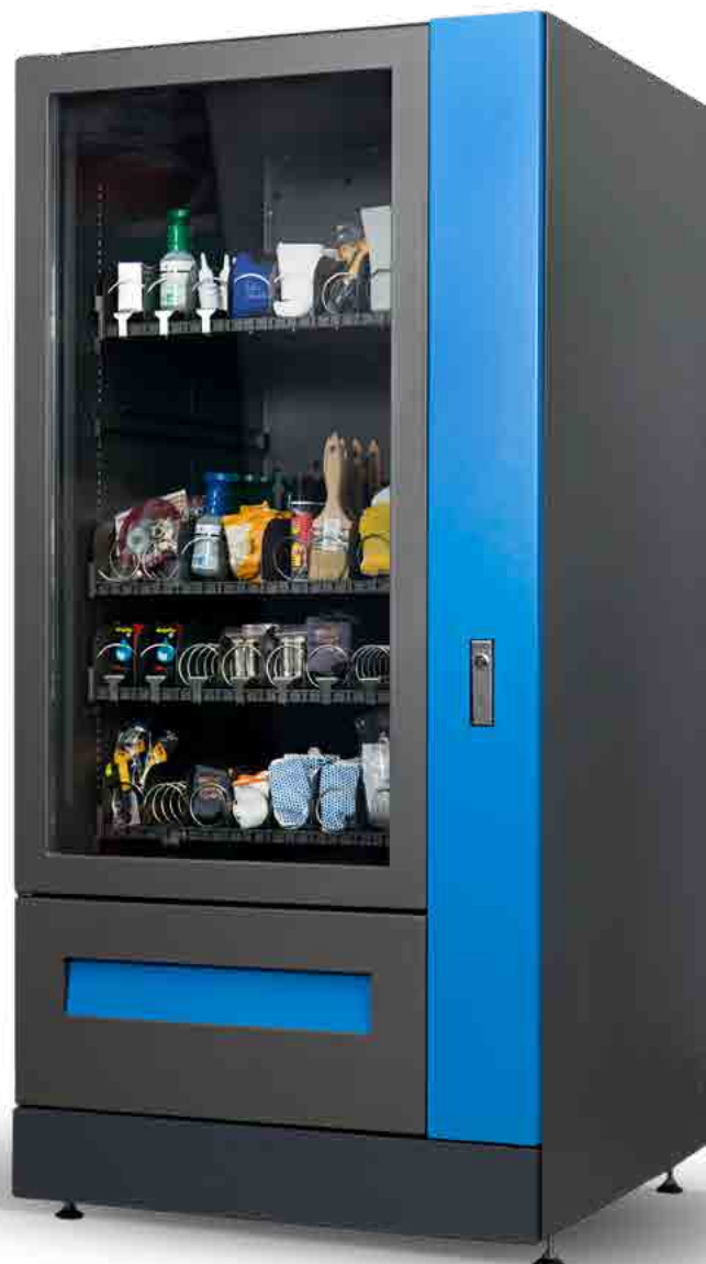
Automat dostępny w wersji z panelem użytkownika oraz bez panelu użytkownika

Imponującą ładowność urządzenia uzyskujemy dzięki możliwości zastosowania różnego rodzaju uzwojenia sprężyn, aż w 5 konfiguracjach ich skoku . Możliwość zamontowania do 7 półek, na każdej z nich dostępne 10 sprężyn, które można łączyć po dwie na większe produkty. Konfiguracja sprężyn jest nieograniczona, na jednej półce mogą być zainstalowane sprężyny pojedyncze i podwójne w różnych rozmiarach jednocześnie. Łatwa zmiana ustawień pozwala na każdorazowe dostosowanie pojemności automatu do aktualnych potrzeb eksploatacyjnych.